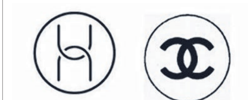
欧盟普通法院判定香奈儿（右）与华为旗下电脑硬件（左）的商标存在差异。

（布鲁塞尔综合讯）法国奢侈品业者香奈儿（Chanel）在与中国企业华为的商标大战中落败。欧盟普通法院裁定，两个商标没有相似之处，判定香奈儿败诉。